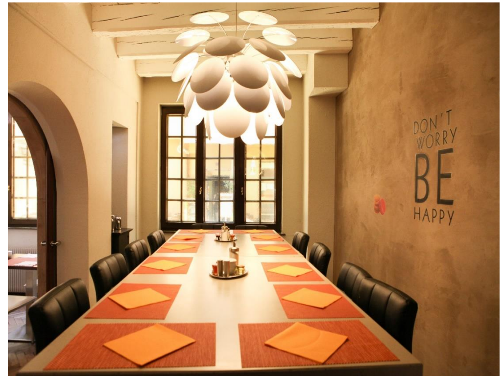
Salle ARGILE – Style Boardroom