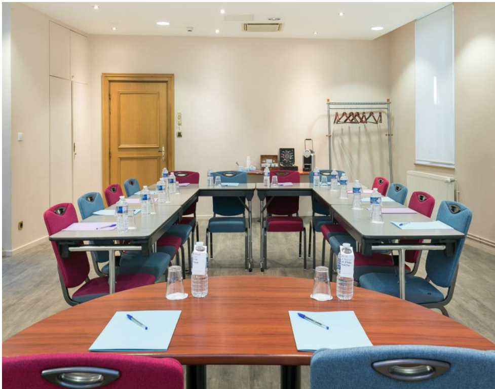
Salle VIGNETTE – Style U